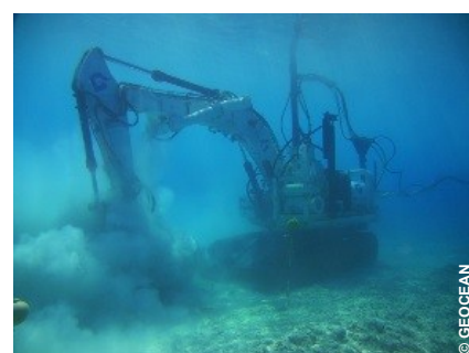
Pelle « ABYSS » GEOCEAN