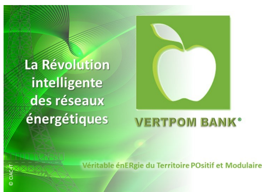
La banque de l'énergie VERTPOM Bank : La Révolution intelligente des réseaux énergétiques