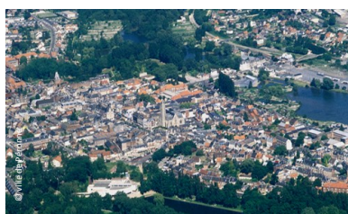
Péronne: réseaux énergétiques internes et externes