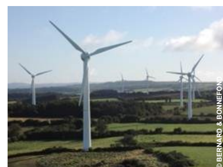
Site d'essai de Plougras pour la pale EFFIWIND